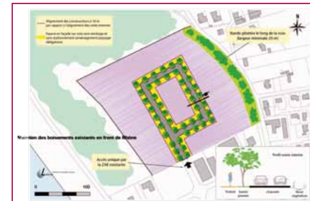
secteur de l'île Neuve Nord

- La zone d'activité de la Croix des Marais étendue dans la partie Nord sur 1,3 ha. ainsi qu'une zone Uia au Nord de la commune le long de la RN7 ; l'objectif est de créer des activités et des emplois en autorisant notamment la réhabilitation de bâtiments en friche.