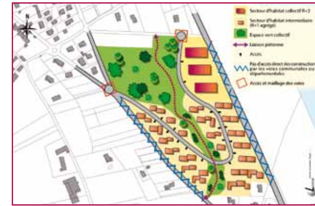
secteur de Fourche Vieille